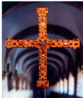
Prunk- und prachtvoll: Domschatzkammer und Diözesanmuseum zeigen kirchliche Schätze Splendor and grandeur: Cathedral Treasure Chamber and Diocesan Museum display clerical treasures