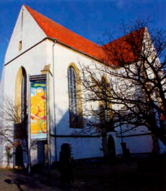
Forum für zeitgenössische Kunst: Kunsthalle Dominikanerkirche | Forum for contemporary art: Art Gallery Dominican Church